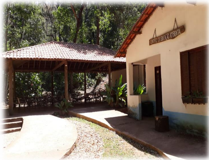
Centro de Educação Ambiental