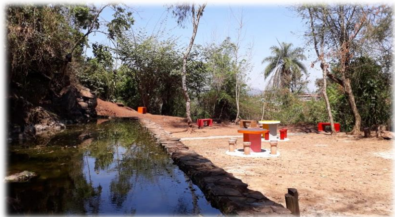
Área de Lazer do Parque