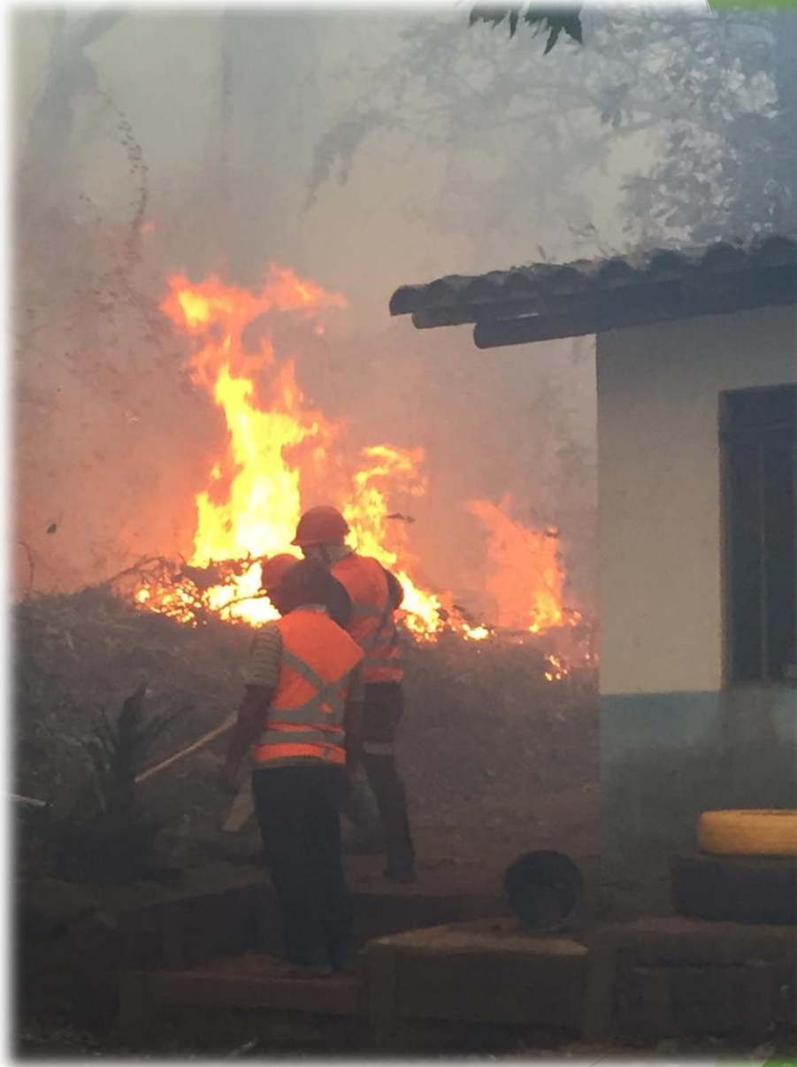
Incêndio ocorrido em Setembro de 2019.