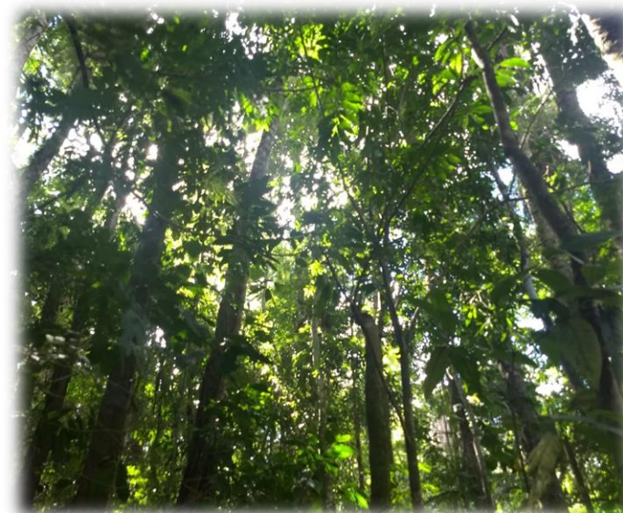
Vegetação presente no interior do Parque